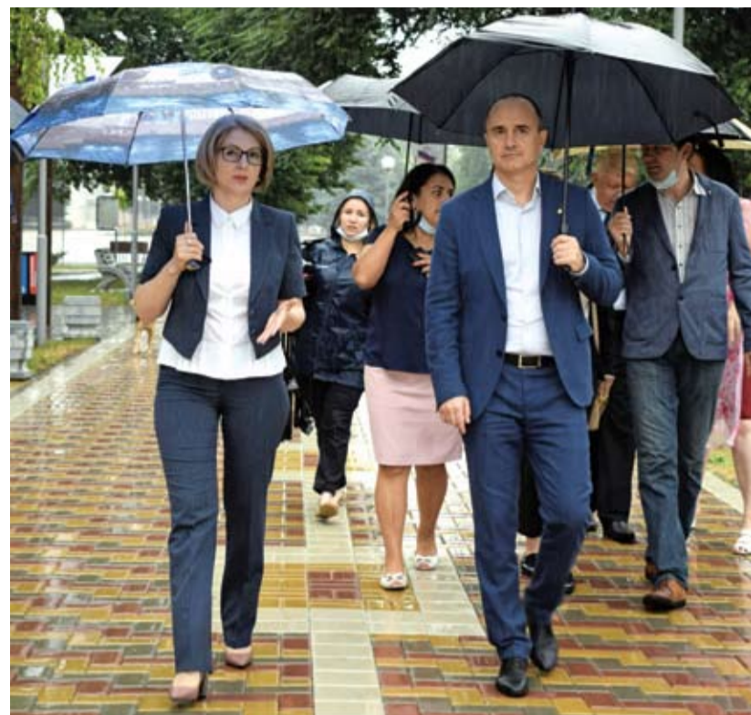
О.К. Косенко с заместителем губернатора Ростовской области И.Н. Сорокиным на ул. Советской поселка Целина, благоустроенной в рамках регионального проекта «Формирование современной городской среды на территории Ростовской области» в рамках национального проекта «Жилье и городская среда».

– В новую государственную программу «Комплексное развитие сельских территорий» – она рас-