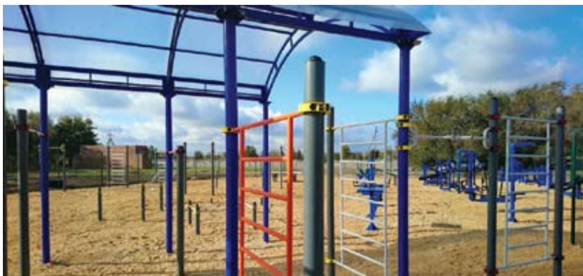
Спортивная площадка – район стадиона поселка Целина.