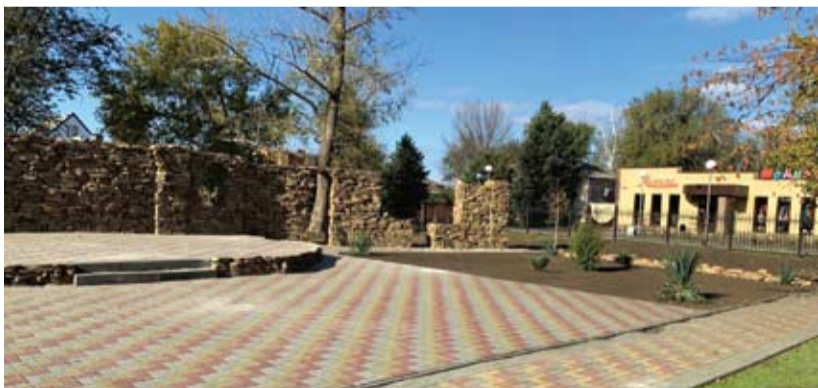
Благоустройство западной части парка культуры и отдыха поселка Целина.