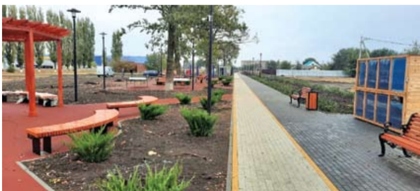
Зона отдыха юго-западного микрорайона поселка Целина.

Геннадий Громов, фото из архива Администрации Целинского района